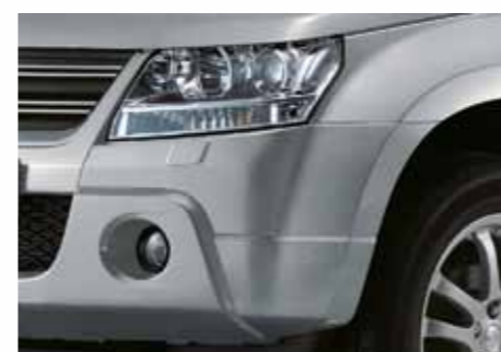
Серебристый металл / Silky Silver Metallic (Z2S)