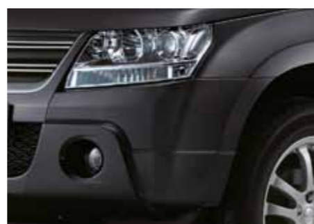
Серый металл / Quazar Gray Metallic (ZMA)