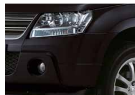
Черный металл / Bluish Black (Z13)